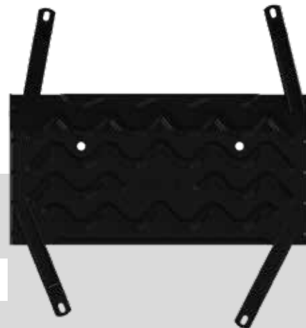
16016 Tracker 2020>2025